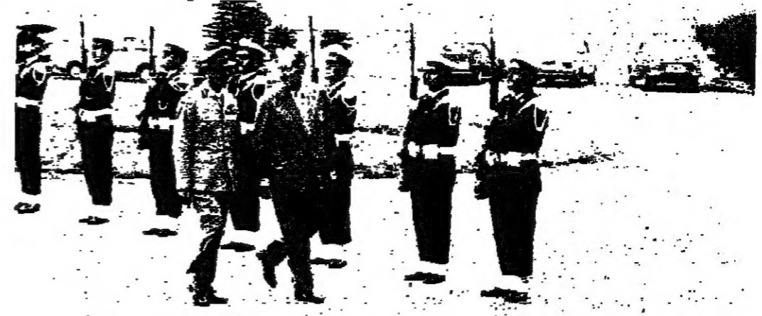
الرئيس شارل حلو يستعرض هرس الشرفي في قصر بعبدا

انتهى الاسبوع السياسي بمورده الى نقطة البداية، ولو بعمليات لتخفف شكلا عن صورة الازمة في اُسبوعها الاول. وما يزال اشراك أو عدم اشراك الكتائب هو العقبة الاساسية في وجه الرئيس المكلف. بعد ان أكد السيد كمال جنبلاط عزمه - هو واعضاء جبهة المتصلين - عن الاشتراك في اعتبارات خاصة. وبدأ من موقف جنبلات امس، وما اعلنه في تصريحاته، انه لن يتصل الازمة نهائيا مع السيد «العزل» الى السيد حلو، وبعده إعلان هذه المطالب سيكون الاسبوع المقبل، وعلى وجه التحديد مطلع الاسبوع، بعد اجتماع الاحزاب والهيئات الوطنية.